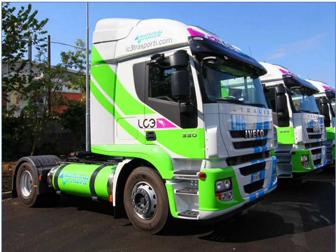
Магистральный тягач Iveco Stralis Natural Power (NP)

А вот на компримированный и сжиженный природный газ резко возрастают.