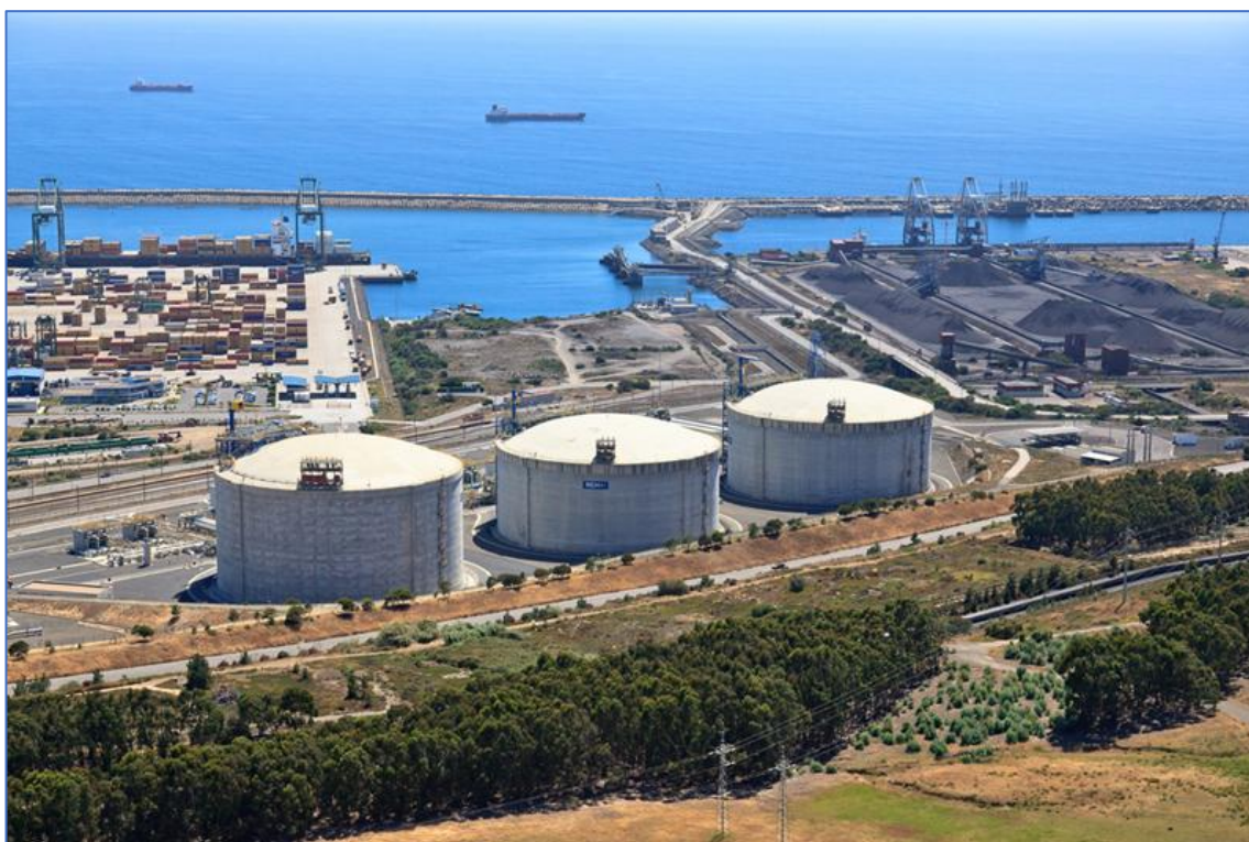
Терминал СПГ в порту Синиш, Португалия.

Невольно возникает ощущение организованного анти-метанового сопротивления. В последние годы в Португалии наметился устойчивый рост спроса на автомобильный СПГ и интерес инвесторов к развитию инфраструктуры его хранения, транспортировки и реализации. Именно в этот момент правительство Португалии фактически наносит удар по рынку чистых видов моторного топлива и усиливает позиции дизельного топлива.