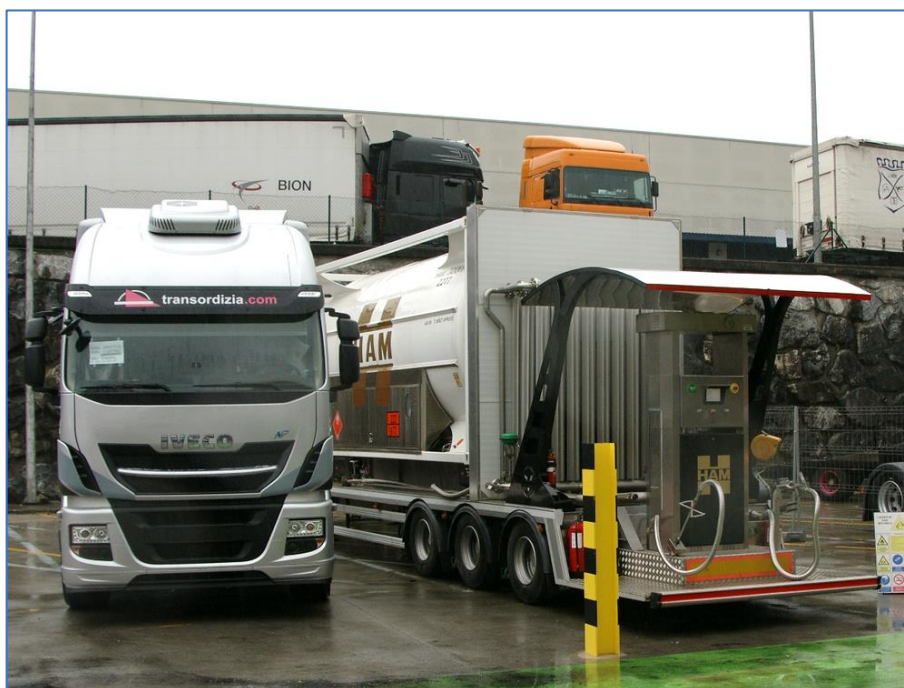
Передвижной заправочный комплекс СПГ (КриоПАГЗ)

Розничная цена дизтоплива на трассовой АЗС в Олаберрие, Испания составляет € 1,11 евро за литр. Бензин Аи-95 стоит € 1,19 за литр, Аи-98 - € 1,31 за литр. Автомобильный пропан обойдется в € 0,62 за литр (или € 0,90 в бензиновом эквиваленте). Цена одного килограмма КПГ и одного килограмма СПГ - € 0,85.