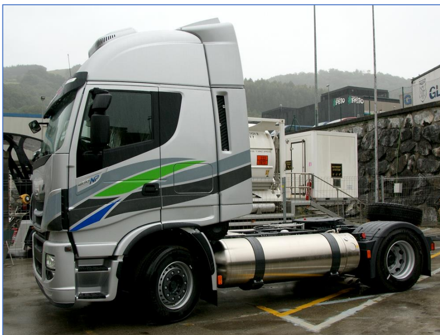
IVECO Stralis NP на СПГ

Сейчас переходят на IVECO Stralis NP: двигатель Cursor 9 NG Euro VI C; объем 8,7 л; 6 цилиндров, рядный; 400 лс (294 кВт) на 2000 об/мин, КПП - автомат. 340-ой машиной водители не очень довольны. По горам она не достаточно мощная. 400-я модель - лучше, она только немного уступает дизельной модификации (460 лс). Практический расход топлива составляет в среднем 31 – 33 кг газа на 100 км.