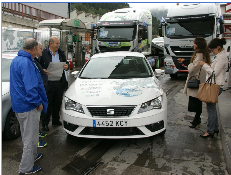
Начало автопробега «Голубой коридор-2017: Иберия –Балтия»

В завершение нужно отметить, что в Испании развивается газификация транспорта не только в грузовом и автобусном сегментах. Испанский SEAT предлагает газовую модель Leon.