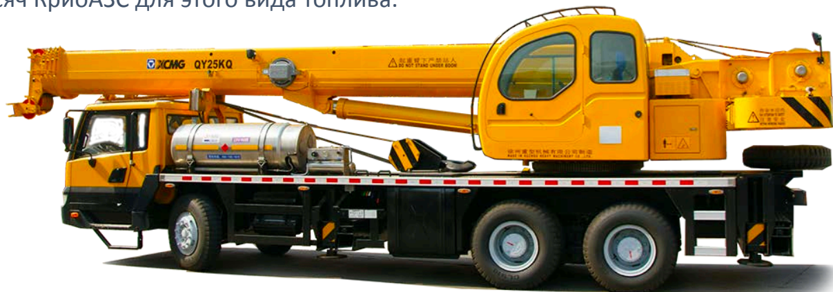
Автомобильный кран на СПГ корпорации XCMG

бильного, водного и железнодорожного транспорта. Осуществляется агрессивная стратегия перевода транспорта на СПГ. К концу 13-ой пятилетки (2020 г.) в Китае должно быть 700 тыс. грузовиков на СПГ (JRJ.com). Проект «Зеленый Китай», начавшийся в 2014 году предусматривает строительство 10 тысяч КриоАЗС для этого вида топлива.